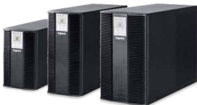
3 101 54